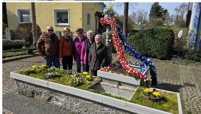
Stolz zeigt man sich nach der Vollendung...

Man kann sagen, dass es eine gelungene Aktion war und der Bürgerverein wird das sicher mit einigen Variationen wiederholen.