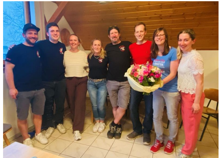
Die bisherige Vorstandschaft