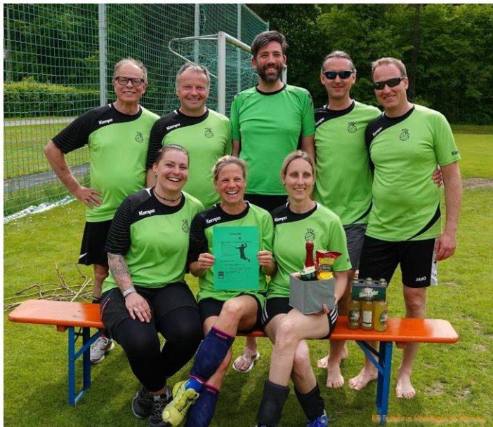
Die Mannschaft des TSV

Mehr Bilder unter tsv-überlingen.de/aktuelles