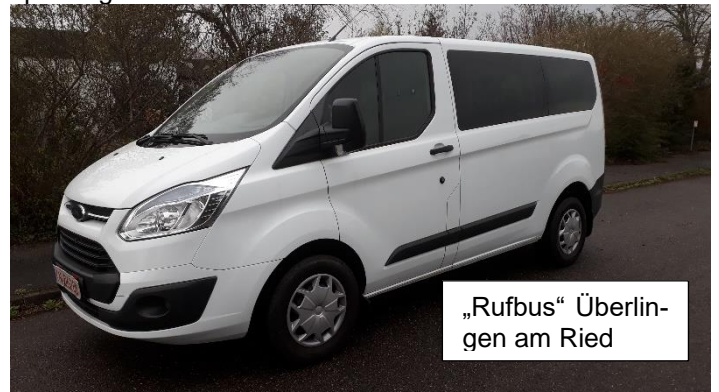
„Rufbus“ Überlingen am Ried

Wenn die Nachbarschaftshilfe die Anerkennung des Landratsamtes erhalten hat, können Leistungen auch über den Entlastungsbeitrag der Pflegekassen abgerechnet werden, wenn er nicht schon von anderen Organisationen in Anspruch genommen wird.