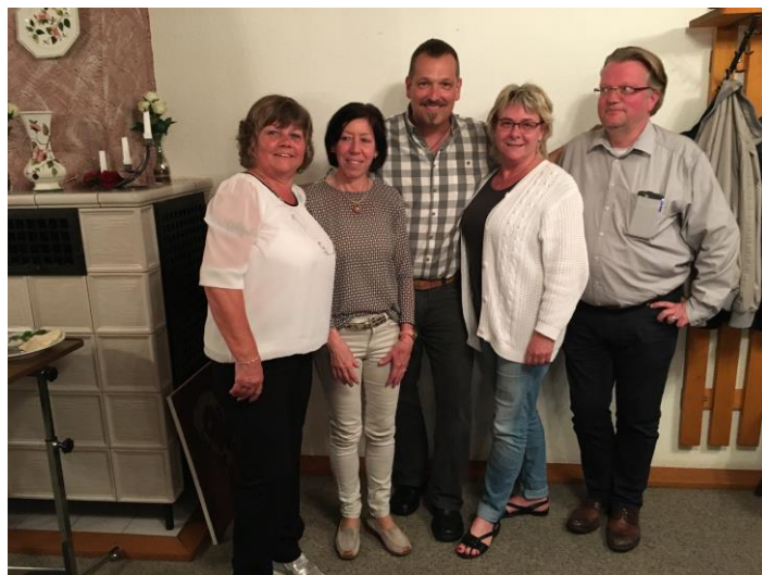
Die neue Vorstandschaft nach einer spannenden Wahl

Um Information von lustigem und kurioseem Dorfgeschehen zur Gestaltung der Fasnacht wird gebeten. Senden Sie bitte Ihre Beiträge an den Zunftmeister unter wagi@tele2.de