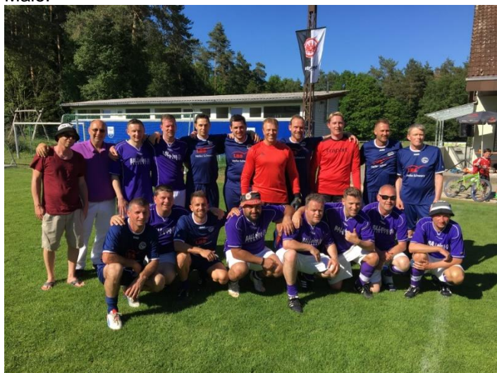
Die Finalisten FC Radolfzell und FV Hausen

In den beiden Halbfinals setzten sich der FC Radolfzell gegen die kurzfristig gegründete SG aus Tengling und Riedheim durch, und der FV Frankfurt-Hausen erreichte zum ersten Mal, seit sie unser Turnier besuchen das Finale. In diesem stand es nach regulärer Spielzeit 0:0, weshalb ein 9-Meterschießen erforderlich war, um den Sieger zu ermitteln. Bei diesem „Glücksspiel“ setzte sich der FC Radolfzell durch, und gewann somit das Turnier zum wiederholten Male.