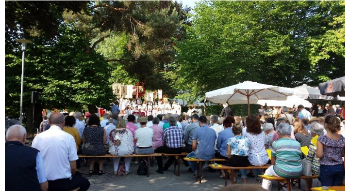
Zahlreiche Gläubige der Seelsorgeeinheit Aachtal feierten in Überlingen am Ried das Fest Fronleichnam. Bei bestem Wetter wurde die hl. Messe auf dem Schulhof gefeiert. Danach ging es in Prozession zum Lindenkreuz und anschließend zur Kirche, wo der feierliche Abschluss mit Te Deum und Segen stattfand.