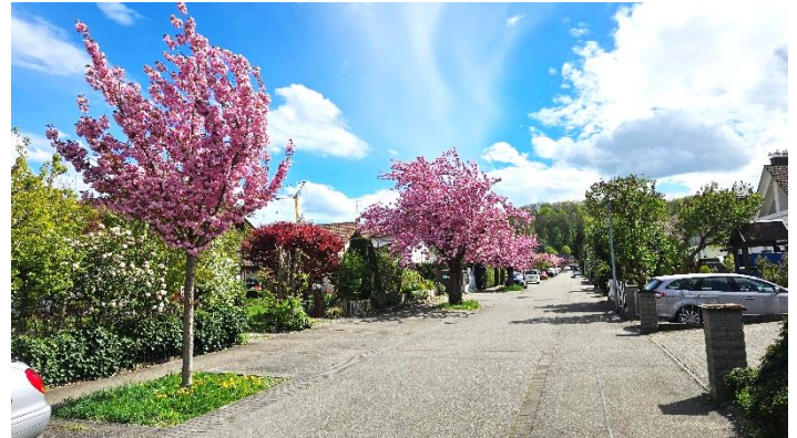
Die japanischen Zierkirschen blühen prächtig.....