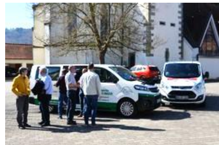
Gespräche und „Fachsimpeln“ bei der Fahrzeugübergabe.