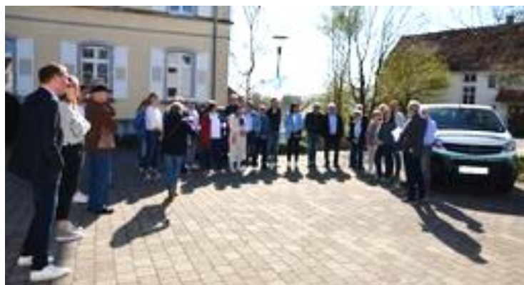
Spender, Werbeträger auf dem Bus, Ortschaftsräte und Vorstandsmitglieder sind zur Übergabe gekommen.